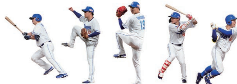
選手5名 ※5選手の選定についてはご要望を承りますが、使用できない選手もございますのでご了承ください。