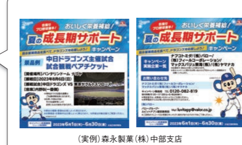
(実例) 森永製菓(株) 中部支店