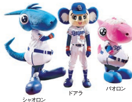
シャオロン ドアラ パオロン