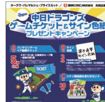
(実例) 理研ビタミン(株)