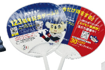
うちわ (杉本食肉産業(株))