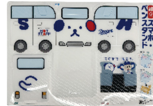
組立スマホ・ベンスタンド ((株)ホットスタッフ)