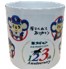
マグカップ(杉本食肉産業(株))