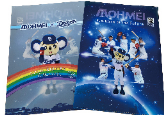
クリアファイル(東明グループ)