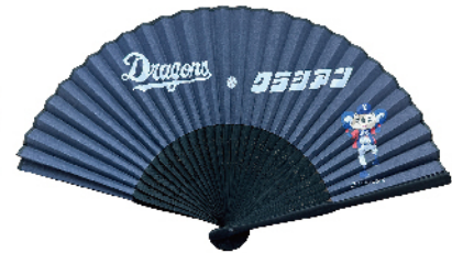
扇子((株)クラシアン)