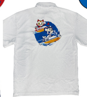
ポロシャツ (ポートレースとこなめ)